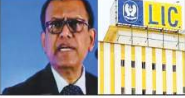
आधार पर 23 मार्च को उनका साक्षात्कार करने के बाद एफएसआईबी ने एलआईसी के लिए चेयरमैन पद के लिए सिद्धार्थ मोहंती को चुना है। जो इस समय

एलआईसी के प्रबंध निदेशक (एमडी) और कार्यवाहक चेयरमैन हैं। उन्हें 14 मार्च से तीन साल के लिए नियुक्ति समिति करेगी। ब्यूरो ने बयान में कहा कि चारों उम्मीदवारों के प्रदर्शन के आधार पर 23 मार्च को उनका साक्षात्कार करने के बाद एफएसआईबी ने एलआईसी के लिए चेयरमैन पद के लिए सिद्धार्थ मोहंती को चुना है। जो इस समय