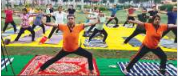
ऊर्जा के साथ जीवन में आगे बढ़ते हैं। इन दिनों उपवास रखने से शरीर और मन पूरे वर्ष स्वस्थ और निरोगी रहता है। प्राणायाम के दौरान उन्होंने कहा कि भक्ति और साधना के साथ-साथ

संकल्पित मन से योग करना भी आवश्यक है। योग का उद्देश्य भी जीवन का सर्वोत्तम विकास है। योग ही स्वास्थ्य का मूल मंत्र है और इस मिशन के द्वारा उनका लक्ष्य है कि प्रत्येक व्यक्ति का स्वास्थ्य उत्तम हो और वह अन्य लोगों को भी स्वस्थ जीवन जीने को प्रेरित करे। योग द्वारा मन और वाणी दोनों पवित्र निश्चल होते हैं। योग मानव को शारीरिक, मानसिक, बौद्धिक और आध्यात्मिक विकास की ओर अग्रसर करता है।